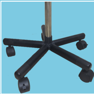
Sudah mempunyai pengunci roda